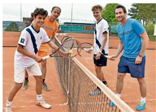
Durch Kontinuität schritt um Schritt vorwärts: Die links und links daneben sind die besten 14 Schweizer Junioren im Jahrgang 2001.