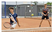
Weggefährten: Hier links und links daneben sind die besten 14 Schweizer Junioren im Jahrgang 2001.